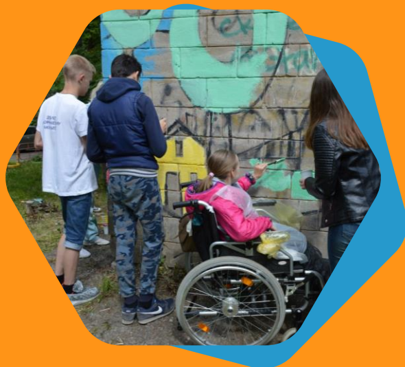
Рисуют все! Нижний Тагил, 2019 г.

Детские рисунки вместо хулиганских граффити на стенах зданий и сооружений