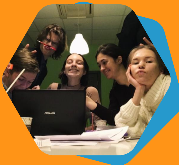
Tet-a-tet, Зеленогорск, 2019 г.

Детские рисунки вместо хулиганских граффити на стенах зданий и сооружений